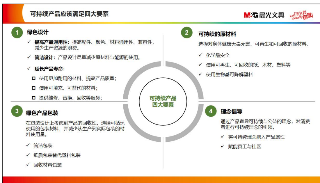
可持续产品四大要素

晨光是国内文具行业里第一个发布 ESG 报告的文具品牌，且以可持续产品作为其可持续发展战略四大支柱之一，经过多年的创新与研发，晨光在使用生物基可降解材料和保护生物多样性等方面取得了多项突破，旨在为消费者提供创新突破的、绿色环保的、品质安心的文具产品，助力行业发展与环境可持续理念的互通，晨光以“引领行业的可持续发展”为可持续战略定位，贯彻负责任治理的核心理念，从全价值链出发，建立可持续发展战略并为实现企业可持续发展愿景而不断努力。